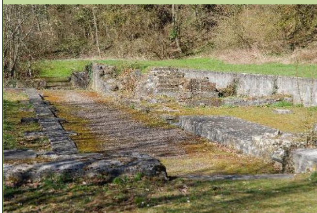
Vestiges Abbaye de Clairlieu

En 1884, la ville décide de déplacer l'établissement hors de la ville pour des raisons d'hygiène. La construction débute en 1897 sur l'emplacement de l'ancien cimetière Saint-Nicolas.