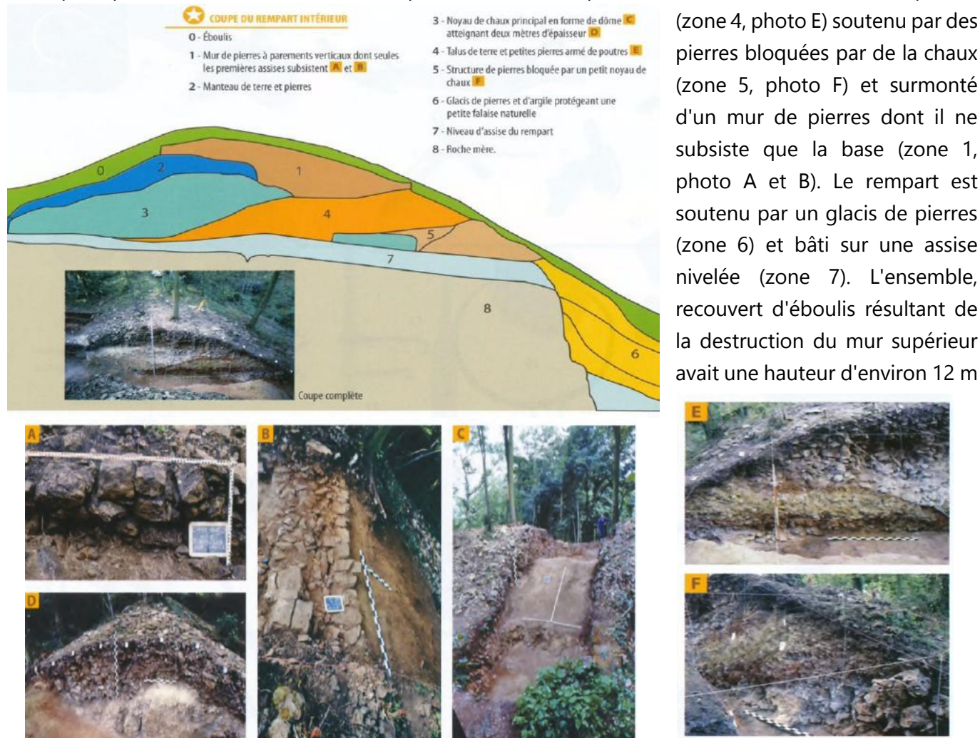
Figure 2 : schéma de la construction des murs de l'enceinte et photos associées des différentes zones du schéma

Cette protection (fortification) par un double rempart de 600 m et complétée par 2 murs simples de 250 et 200 m représente un travail gigantesque qui n'a pu être effectué que par une riche société aristocratique avec un objectif de montrer sa puissance. La situation en position de contrôle de la vallée de la Moselle et des voies commerciales renforce cette idée de puissante résidence princière... Si aujourd'hui ces remparts ont l'aspect de simples talus (photo 2), des fouilles menées de 1980 à 1988 ont révélé une construction complexe selon une architecture précise alliant la pierre, l'argile, le bois et la chaux (figure 2) qui a nécessité des techniques avancées, des architectes, beaucoup de travail et une main-d'œuvre nombreuse : il est à noter principalement l'assise de chaux fabriquée in situ (zone 3, photo C et D), le talus de terre et de pierres (zone 4, photo E) soutenu par des pierres bloquées par de la chaux (zone 5, photo F) et surmonté d'un mur de pierres dont il ne subsiste que la base (zone 1, photo A et B). Le rempart est soutenu par un glacis de pierres (zone 6) et bâti sur une assise nivelée (zone 7). L'ensemble, recouvert d'éboulis résultant de la destruction du mur supérieur avait une hauteur d'environ 12 m