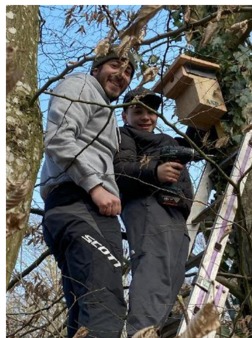
Même pas peur !

Ces actions ont profité également à nos amis volatiles puisque tous les nichoirs posés l'an passé dans le parc ont été occupés par des mésanges. Souhaitons maintenant que les chouettes hulottes et les