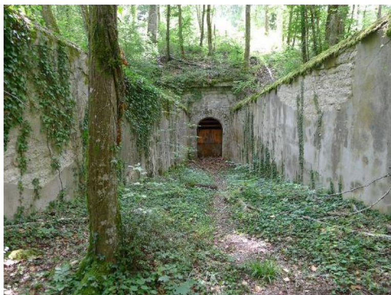
Poudrière de Bois-sous-Roche