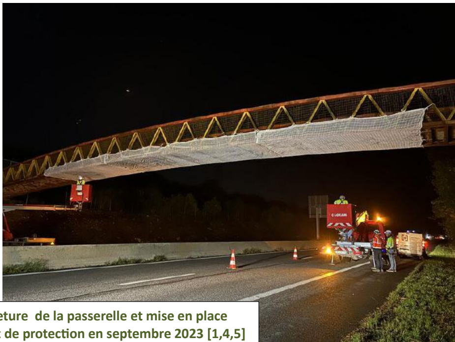
Fermeture de la passerelle et mise en place d'un filet de protection en septembre 2023 [1,4,5]