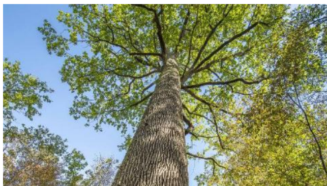
Chêne remarquable de la forêt de Tronçais