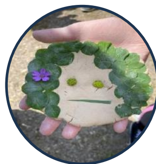
Autoportraits réalisés par les élèves sur galettes d'argile